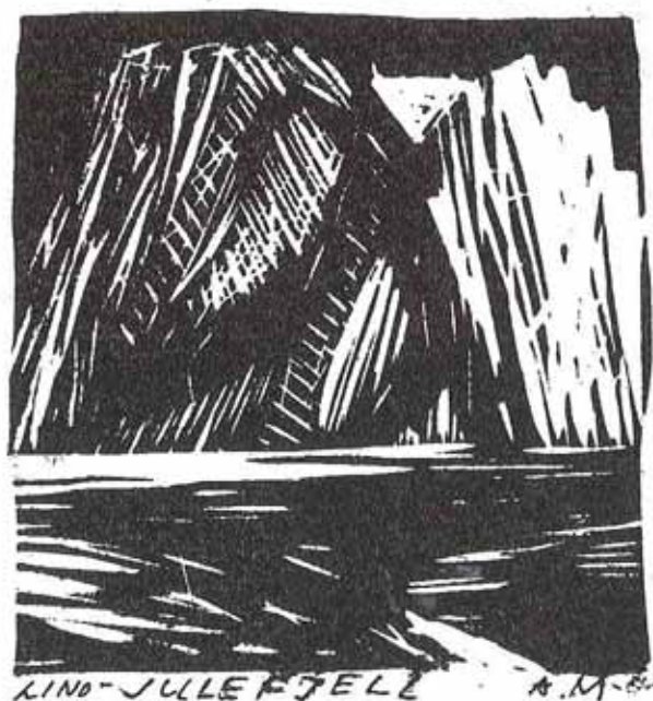
LIND-JULLEFJELL A.M. 1944